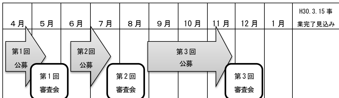
募集・受付期間の予定

審査会后、事業の採択・不採択を決定し、応募者に通知します。採択された場合、事業者は補助金交付申請書をセンターに提出し、交付決定後、事業に着手することとなります。(P7「補助事業の流れ」参照)